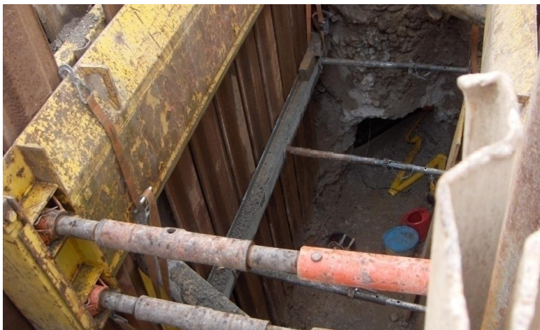
Grabenspriessung für Verlegung GUP-Rohre NM 800