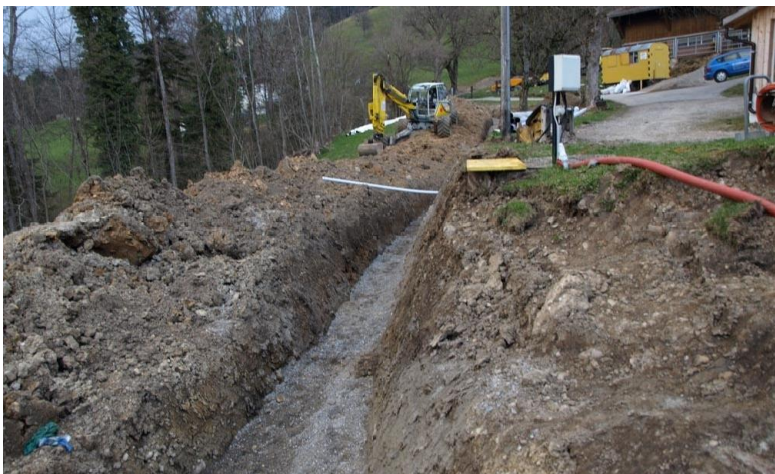
Kanalisations-Grabarbeiten im Waldabschnitt