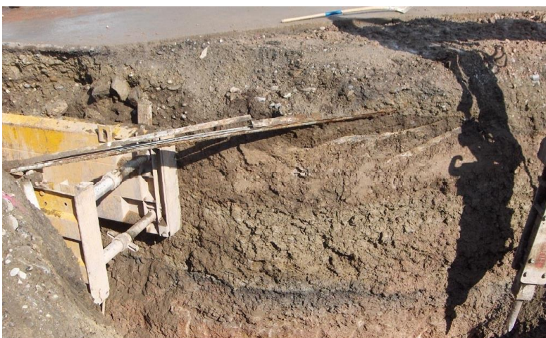
Ausschnitt GEP (Stand 2007)