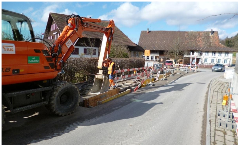
Grabarbeiten für Meteorwasserleitung