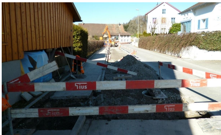
Grabarbeiten für Meteorwasserleitung