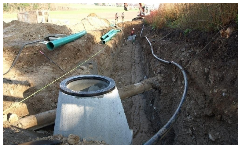
Bauarbeiten , Realisierung Trennsystem