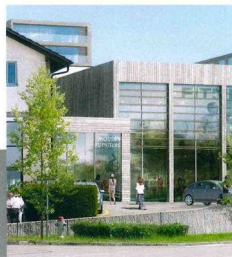
Wetzikon im November 2015