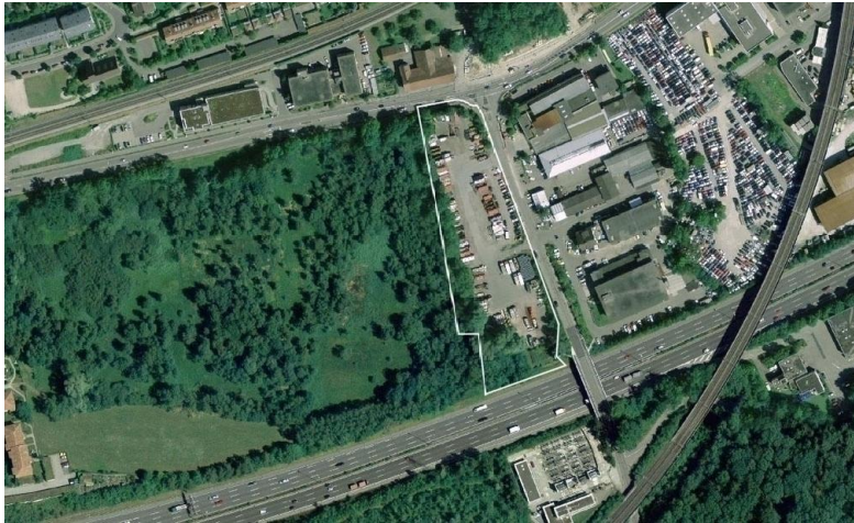
Orthophoto mit GP-Perimeter