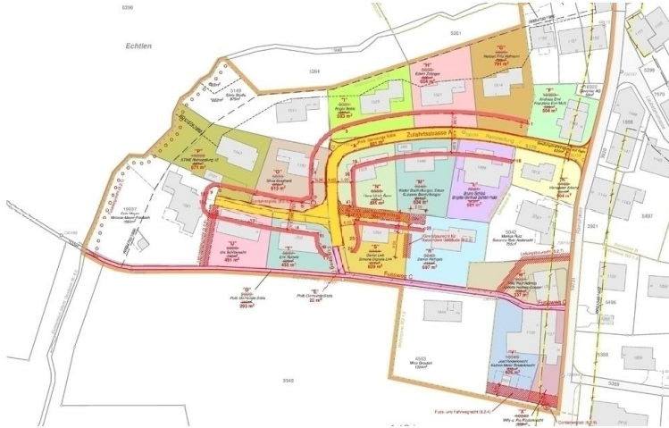
Situation Neuzuteilung Quartierplanentwurf