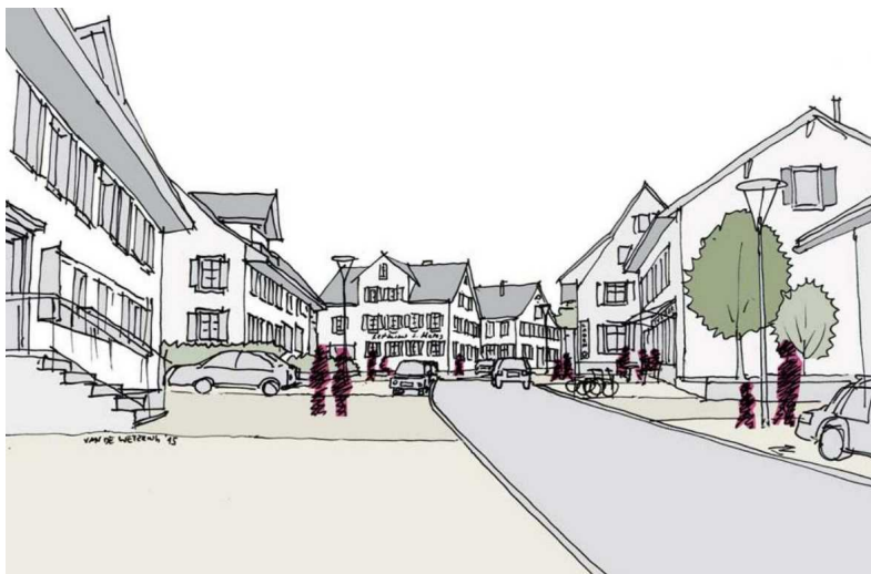
Ansicht Dorfstrasse (Van de Wetering, Zürich)