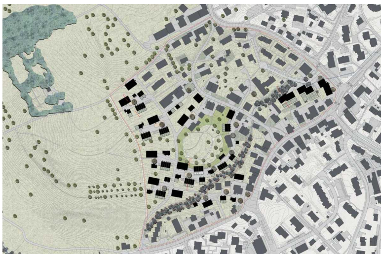
Planungskonzept (FuturaFrosch, Zürich)