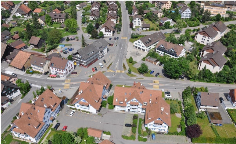
Flugaufnahme mit Kreuzungsbereich