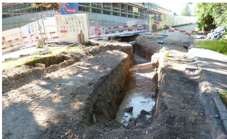
Grabarbeiten für Wasserleitung