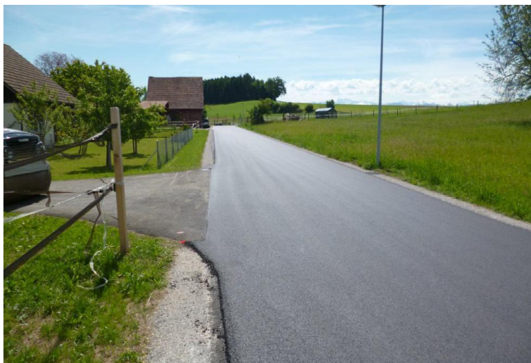
Hinwilerstrasse nach Sanierung