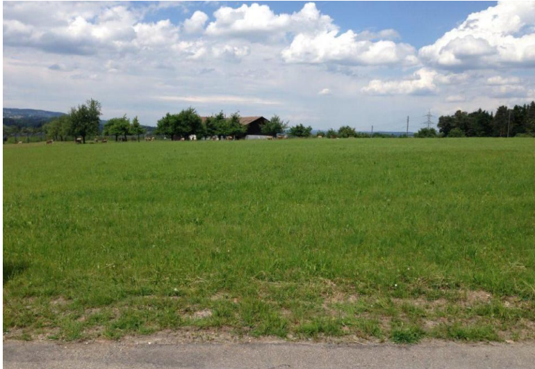
Bestehender Terrainverlauf vor Baubeginn