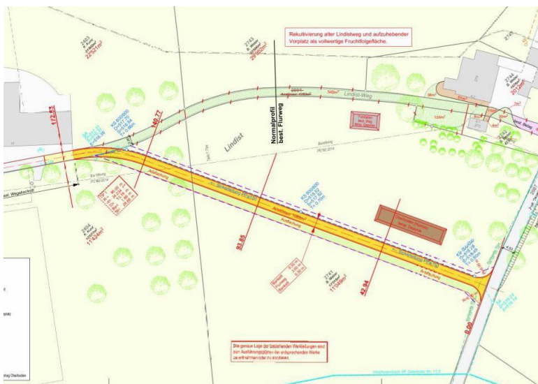
Situation mit Wegverlegung