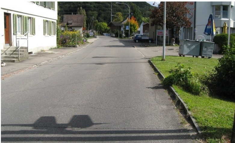
Tablatstrasse vor Sanierungsbeginn