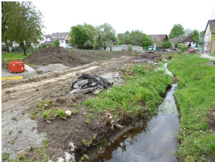
Bauarbeiten Ausbau Dorfbach 1. Etappe