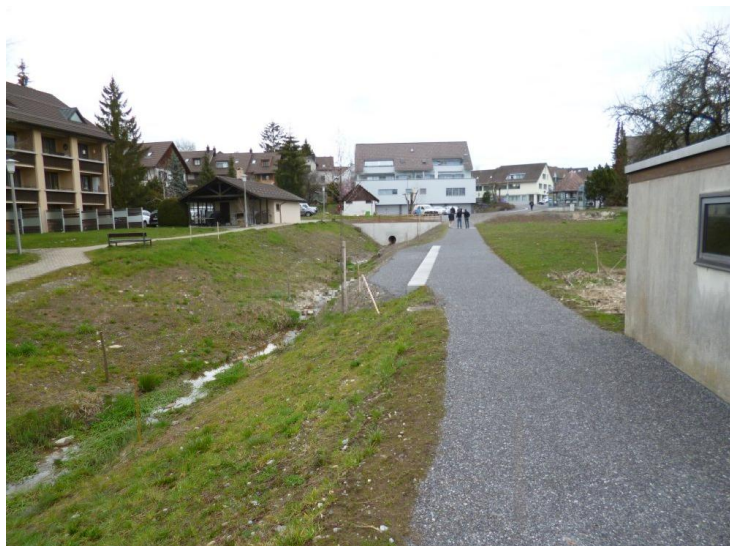
Sanierter Dorfbach mit Fussweg