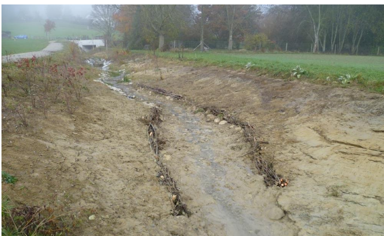
Endausbau Dorfbach Madetswil