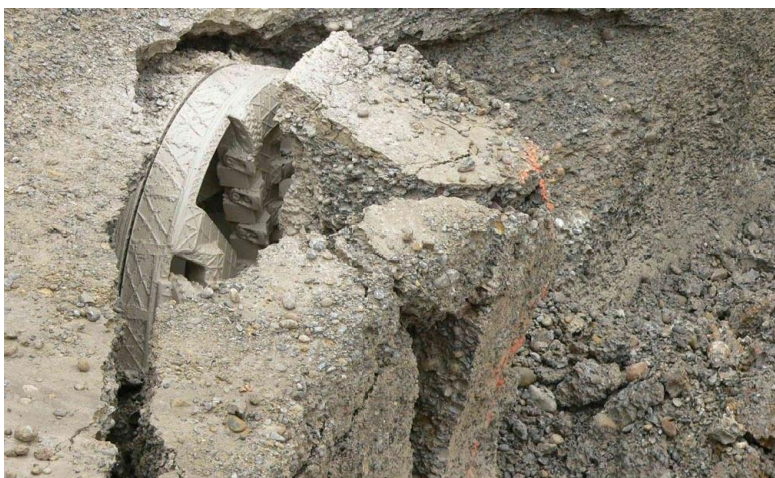
Durchstich Microtunneling / Bohrkopf \varnothing 1450 mm