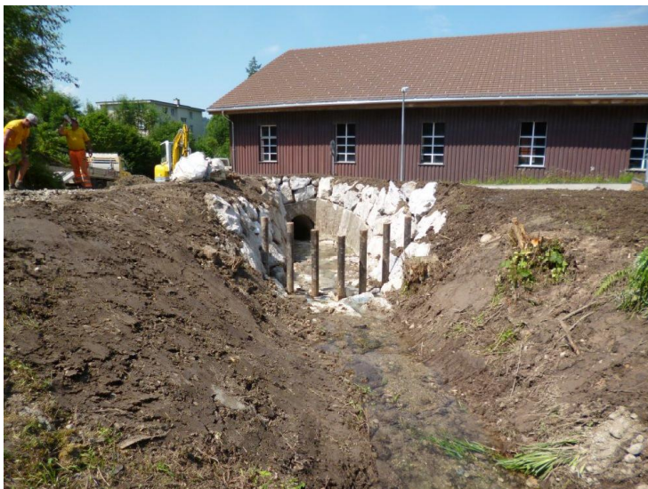
Objektschutz gegen Naturgefahren