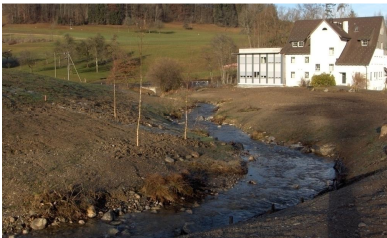
Der Tobelbach fliesst im neuen Bachbett