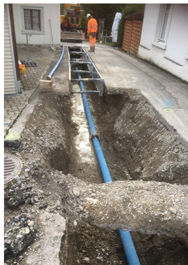
Bauarbeiten Ersatz Wasserleitung