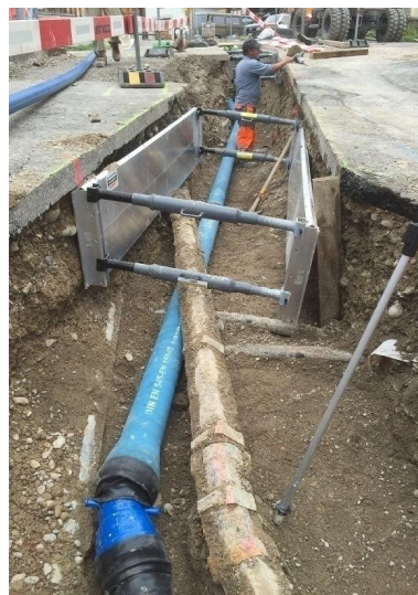
Bauarbeiten Ersatz Wasserleitung