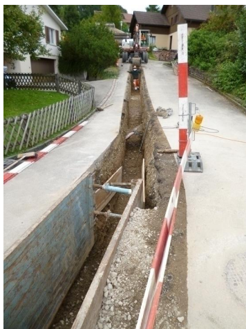
Arbeiten an der neuen Wasserleitung